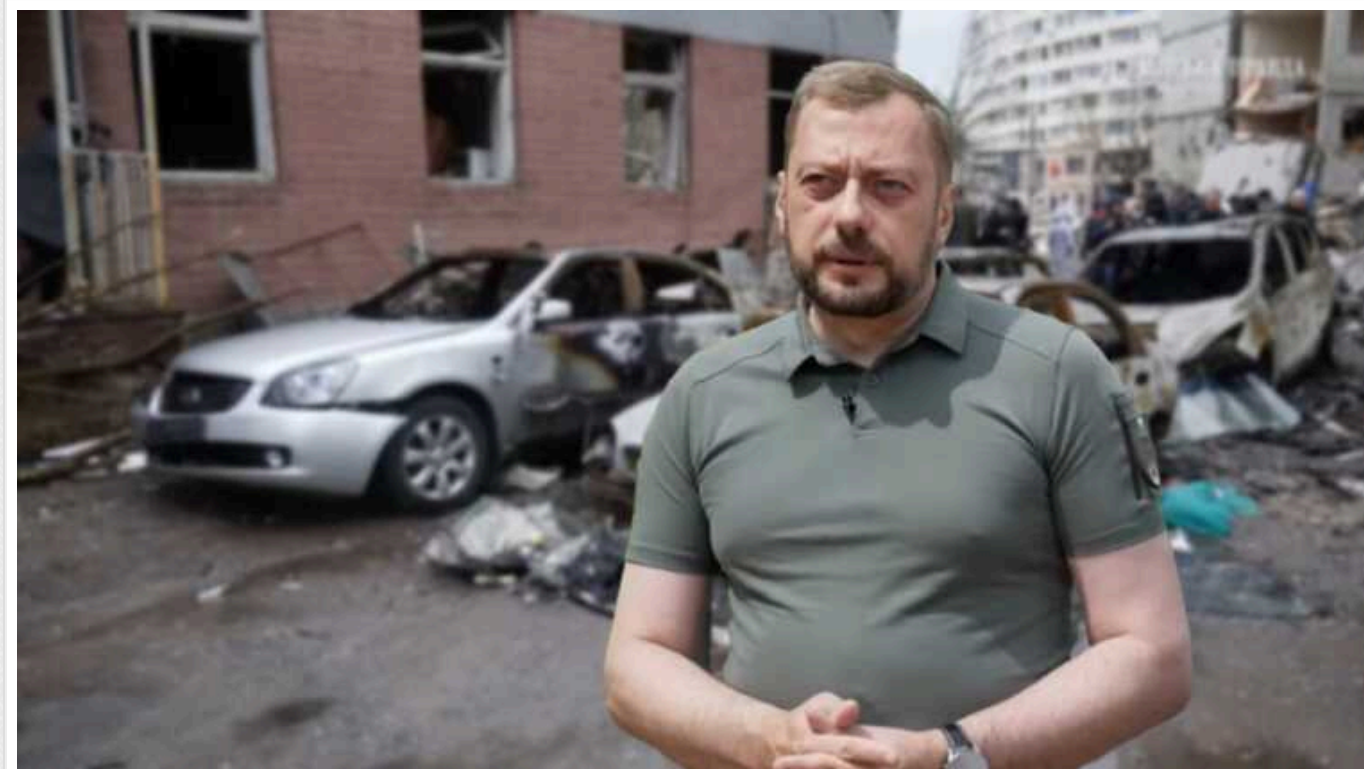
РФ здатна за кілька тижнів сформувати новий контингент для повторного наступу на Чернігівську область - Чаус

Російська Федерація здатна протягом тижня-трьох сформувати контингент для повторного наступу на Чернігівську область.