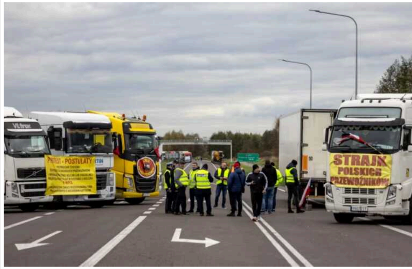
У Польщі фермери знову готуються до відновлення блокади українсько-польського кордону

Польські фермери, які раніше призупинили блокування українсько-польського кордону, готові відновити протест.