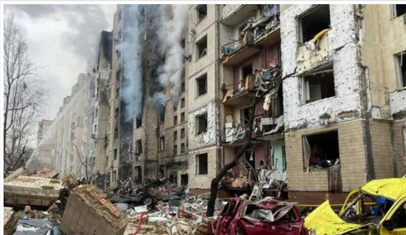
Щоб корегувати удари по Києву, окупанти хакнули вебкамери: СБУ заблокувала їх

Служба безпеки України заблокувала вебкамери, які "засвітили" роботу ППО під час ракетної атаки Росії на Київ 2 січня.