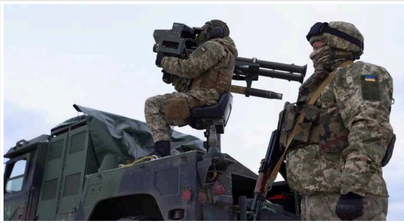
Мобільні групи ППО на Сумщині застосували кулемети та автомати для знищення ударних БпЛА ворога

Прикордонники збили два ударні БпЛА "Shahed-136/131", які атакували Україну з російського кордону.