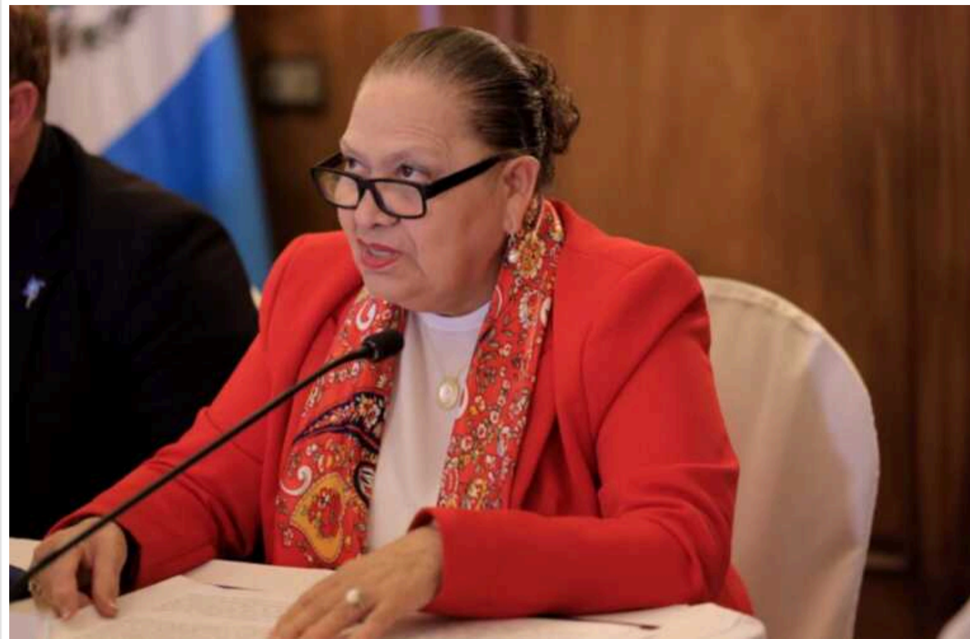
Проект розслідування корупції та організованої злочинності назвав генпрокурорку "Корупціонером 2023 року"

Філософ та історик Ханна Арендт зазначала, що деякі з найуспішніших лідерів нацистської партії були не фанатиками чи соціопатами, а скоріше бюрократами, які заради справи допускали вбивства та корупцію. Їхня розважлива ефективність лише посилює жах того, що відбувається, і Арендт назвала це «банальністю зла».