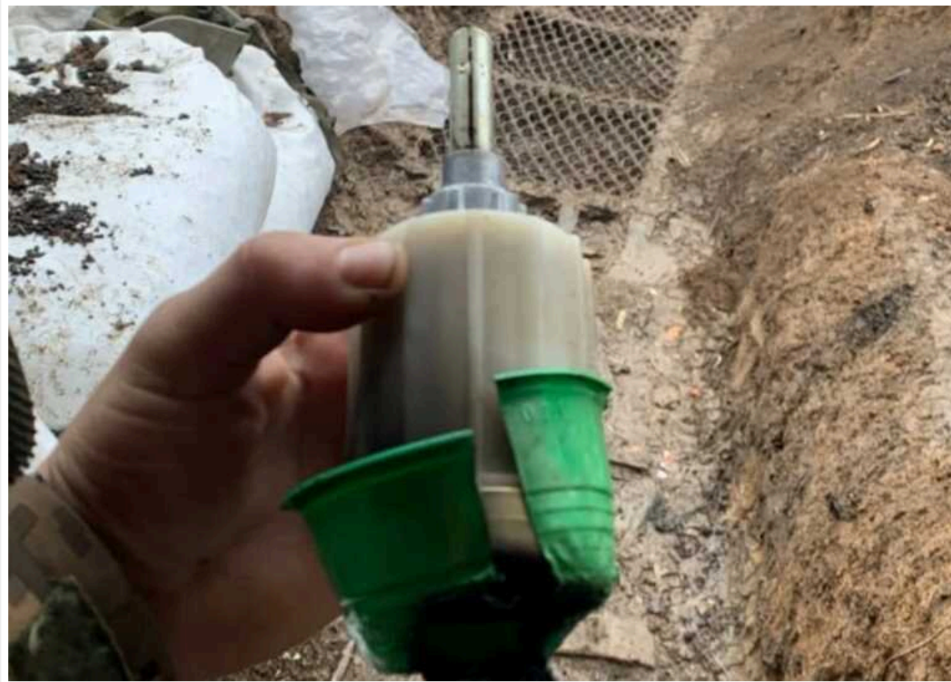
Боєць ЗСУ розповів про ситуацію під Кринками: намагаються прорватися і скидають з дронів хімотруту

Ворог обстрілює позиції Сил оборони з танків та застосовує хімречовину невідомого походження, розповів доброволець 24 ОШБр "Аїдар".