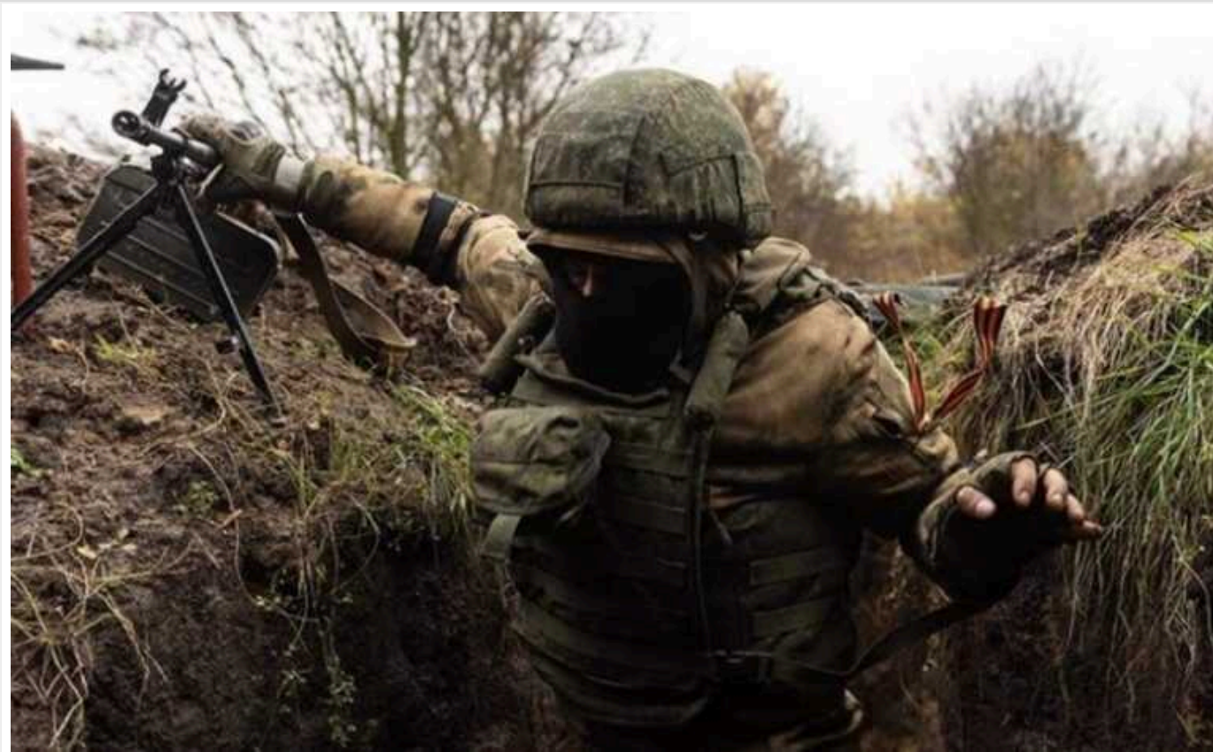
Окупанти масово тікають із захоплених українських регіонів, - ЦНС

За даними українського підпілля, рекордна кількість російських солдатів тікають зі служби або відмовляються виконувати завдання від командування. У результаті на них заводять кримінальні справи, а від народу це намагаються приховати.