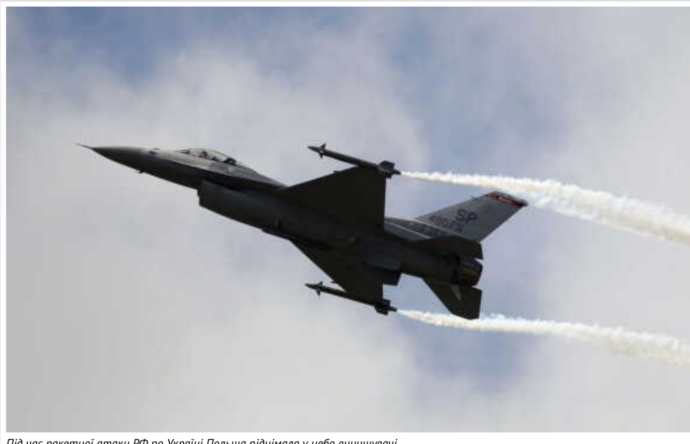
Під час ракетної атаки РФ по Україні Польща піднімала у небо винищувачі

Під час ракетної атаки Росії на Україну Польща піднімала у небо дві пари винищувачів F-16.