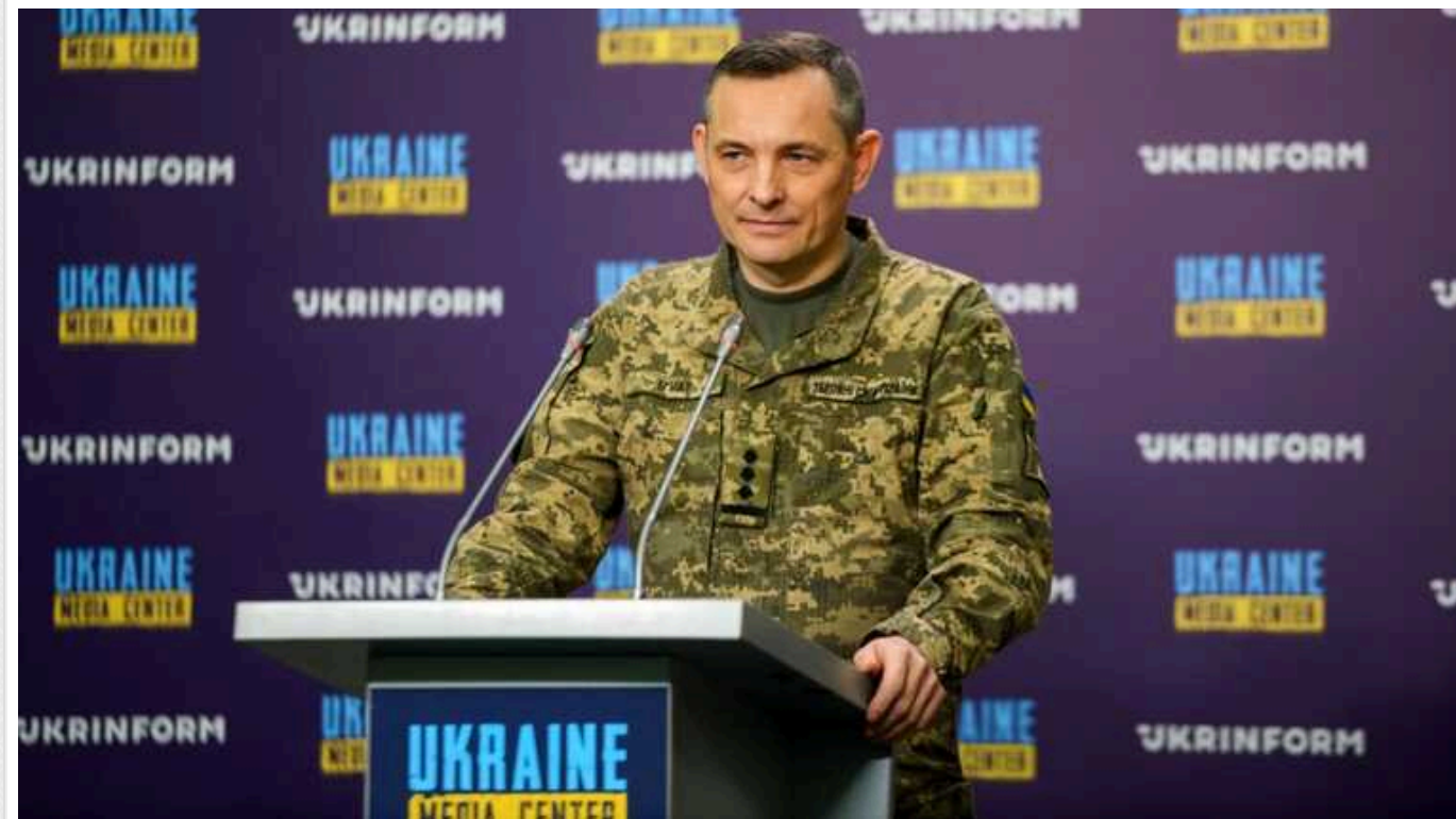
У Повітряних силах відповіли, скільки РФ знадобиться часу на підготовку нового ракетного удару

Росії може знадобитися ще чотири дні для того, щоб підготувати новий ракетний удар по Україні після сьогоднішньої атаки.