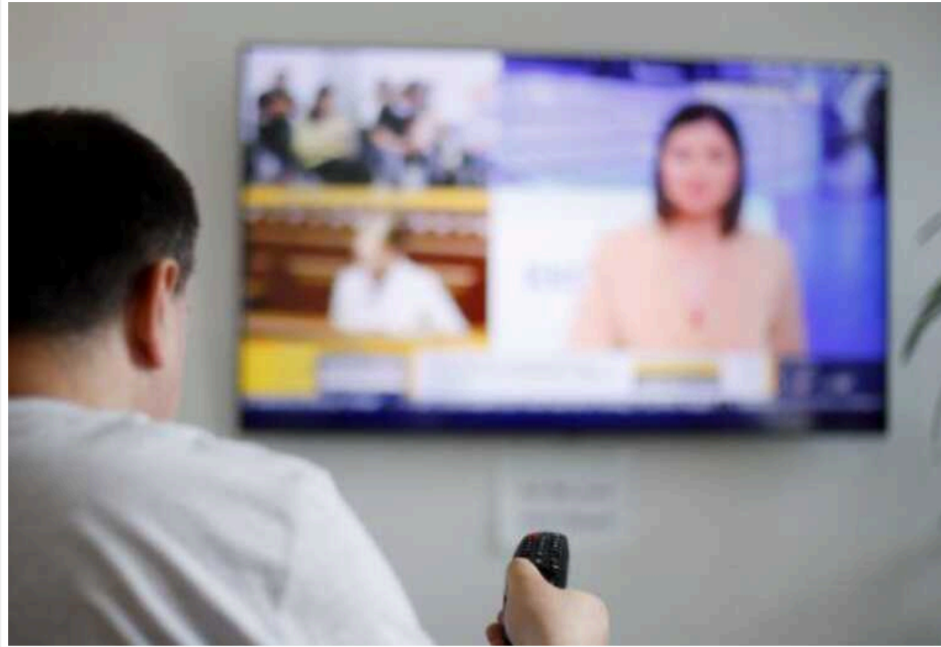
В Україні розглядають нові формати телемарафону "Єдині новини", - Мінкульт

Українські телеканали розглядають нові формати для телемарафону "Єдині новини". Відповідні пропозиції вироблять найближчим часом.