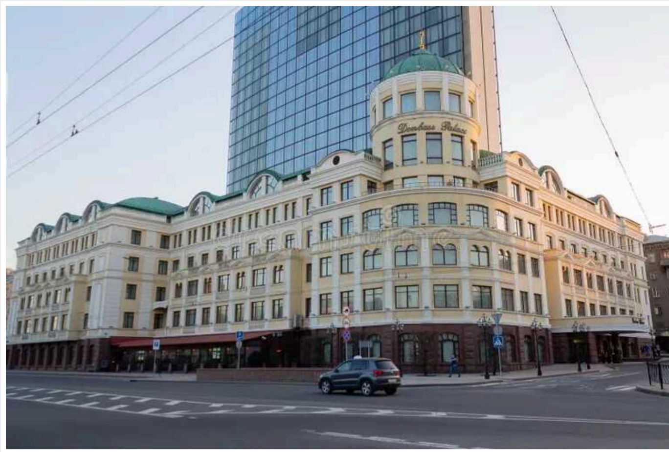
Загиблий в "Донбас Паласі" воєнкор виявився нікому не потрібен