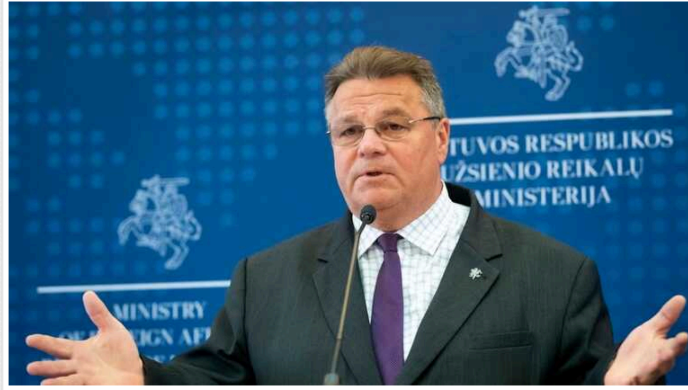
Ексголова МЗС Литви Лінкявічюс потролив новорічне привітання Путіна: "Лайно поперед, в минулому і під ногами"

Колишній міністр закордонних справ Литви Лінкявічюс (2012-2020) прокоментував новорічне звернення диктатора Володимира Путіна до росіян. Політик звернув увагу на слова президента РФ про те, що "Росія нікуди не відступить".