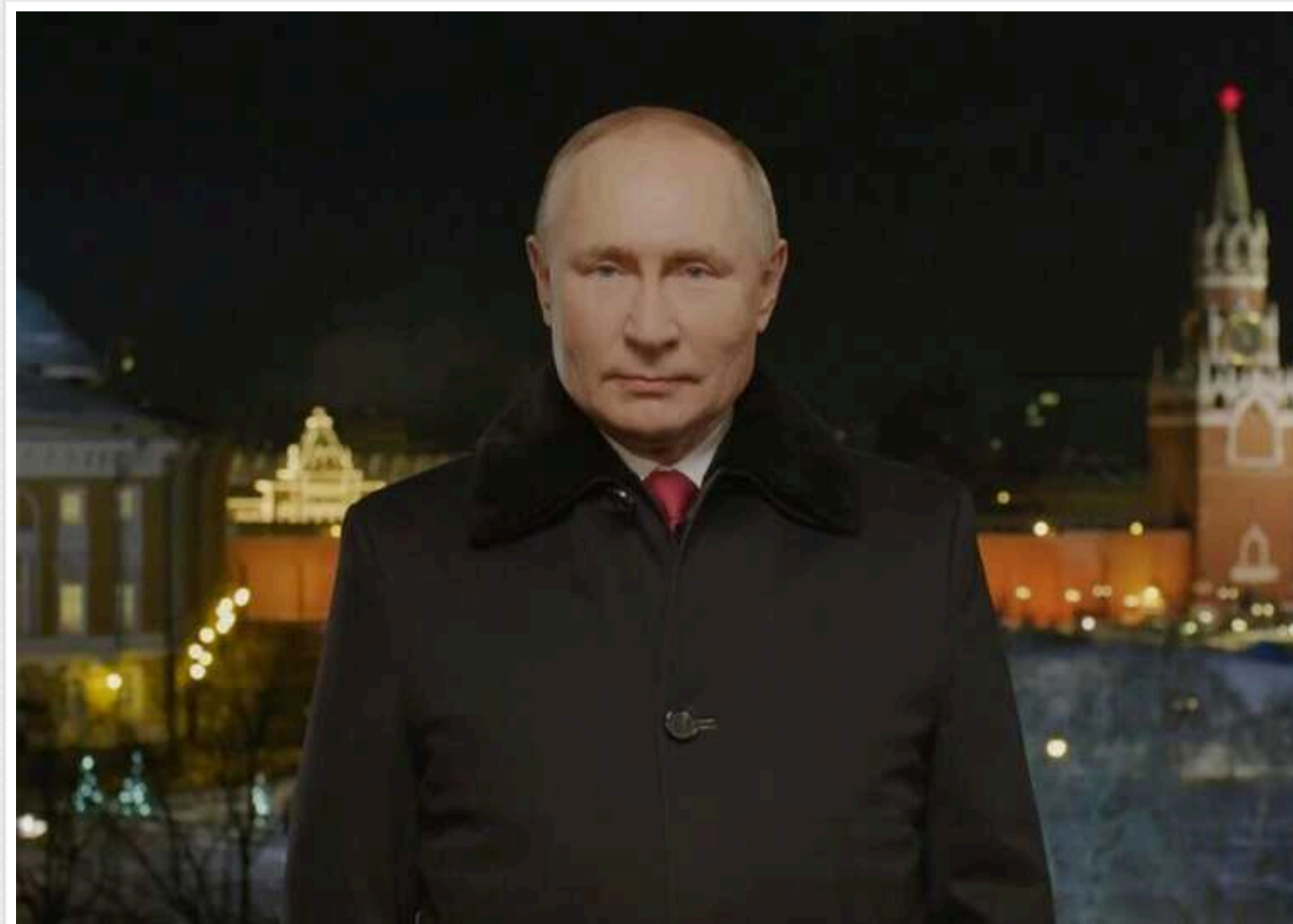
Хакери зламали інтернет-провайдера РФ та показали правдиве звернення Путіна про провал на фронті та втрати

Хакери показали громадянам країни-агресора РФ версію новорічного звернення їхнього президента Володимира Путіна, більш наближену до реальності. У ньому диктатор "говорив" про провал армії РФ на фронті, її великі втрати в живій силі, стратегічні помилки російського командування і невідготовленість військ.