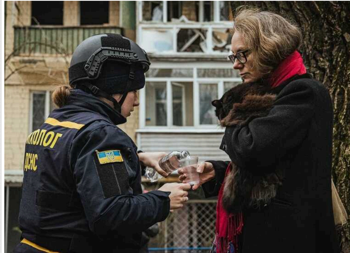
Кличко показав наслідки пожежі у багатоповерхівці після ракетного обстрілу

"Виїхав до багатоповерхівки у Солом'янському районі столиці, де сталося загоряння внаслідок ранкової ракетної атаки. Картина гнітюча... Зараз на місці працюють рятувальники, пожежні, медики. На цю годину одна жінка загинула, постраждали 33 людини. 32 із них медики госпіталізували", - про це написав столичний мер Віталій Кличко.