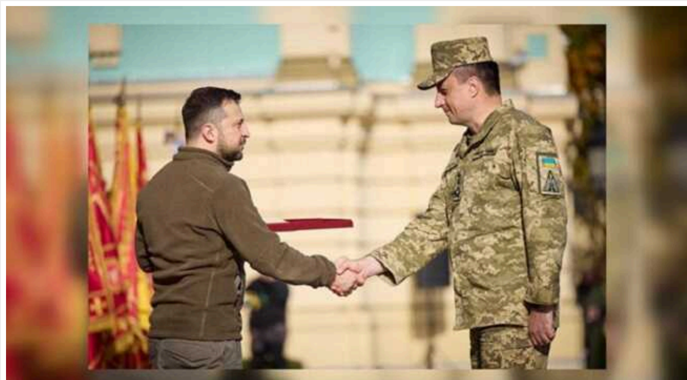
Герой України Микола Олещук: про подвиги командувача Повітряних сил в умовах незакритого неба

З 24 лютого 2022 року Силами оборони України знищено 1709 ракет різних типів. З початку вторгнення знищено 329 літаків та 324 гелікоптери противника. Таку статистику днями опублікував Командувач Повітряних сил Збройних сил України Микола Олещук. Легендарна людина, яка стоїть за ефективною організацією повітряної оборони Києва та інших міст.