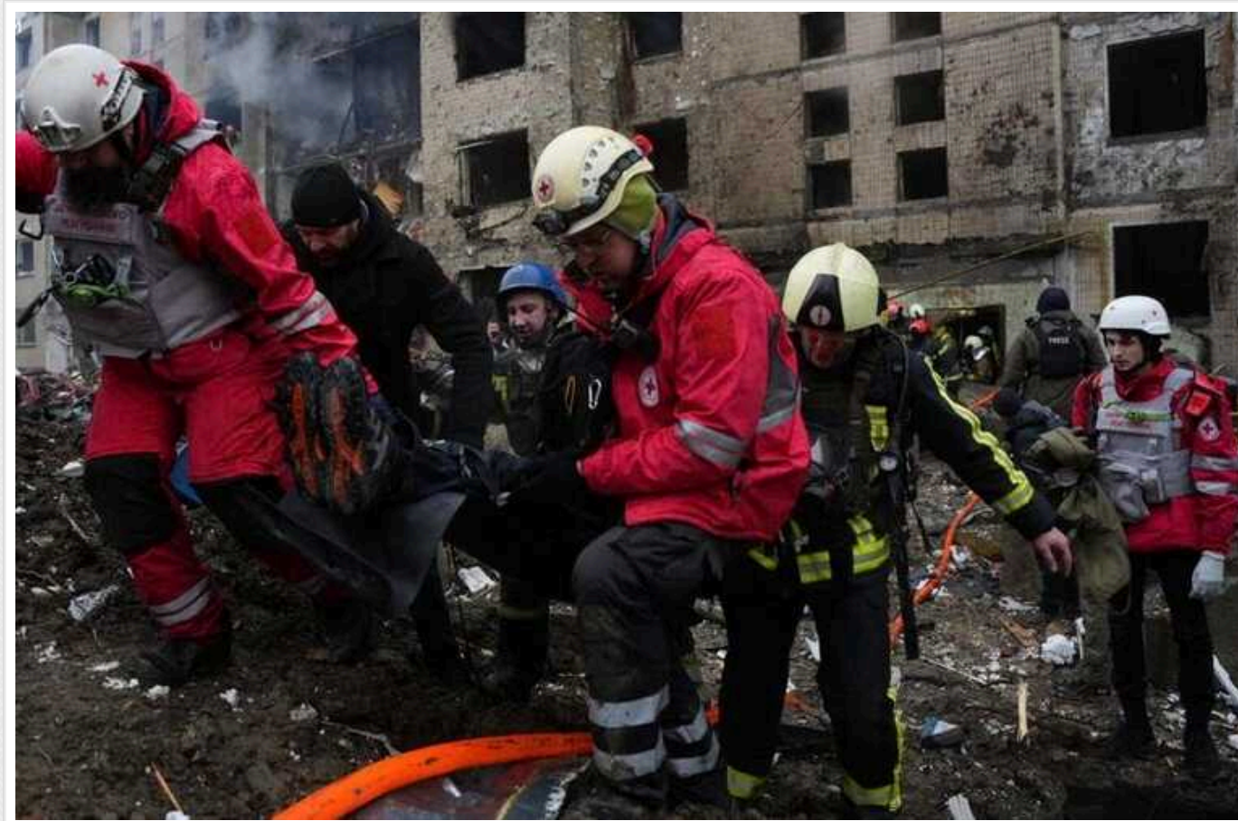
У Солом'янському районі Києва вже двоє загиблих