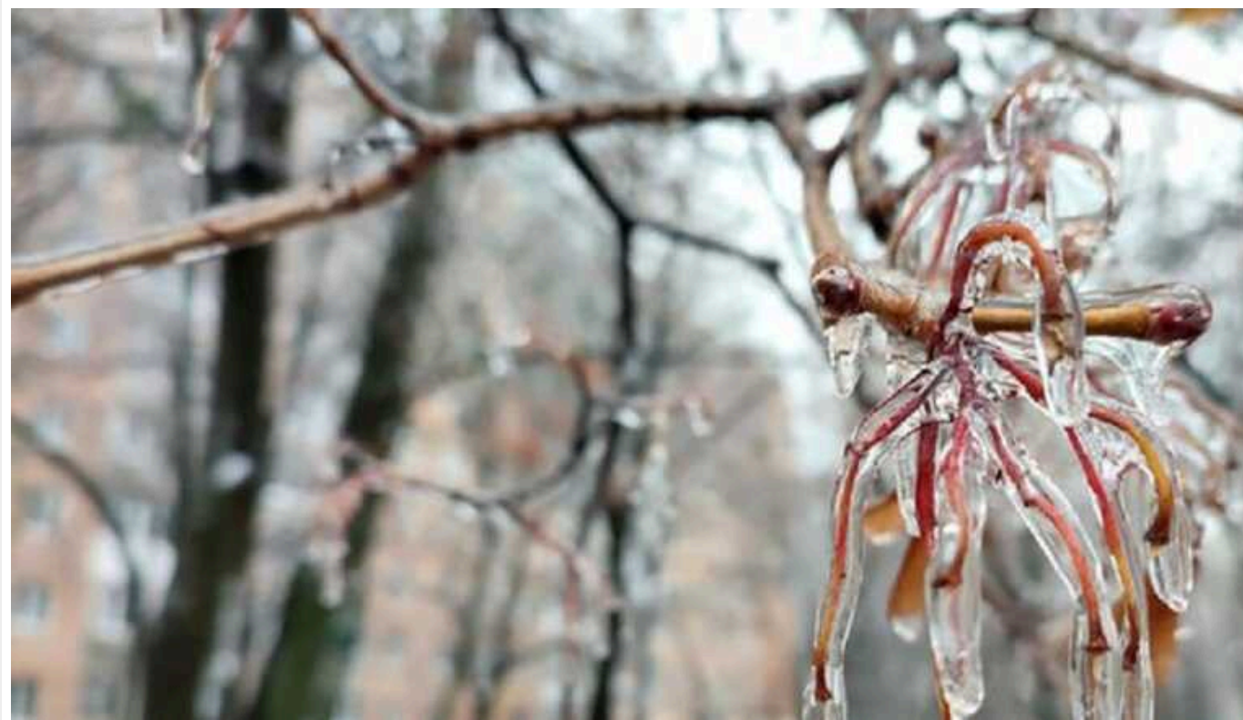
В Україну йдуть морози: метеорологиня розповіла, коли очікувати до -15 градусів

До України прямує холодне повітря з Арктики. У деяких регіонах дощі та "плюсова" температура вже цього тижня зміняться на сніг і ожеледицю на дорогах.