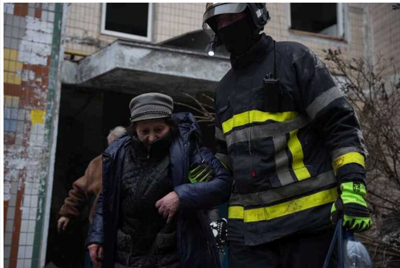
Четверо загиблих та 92 поранених внаслідок сьогоднішньої атаки ворога, – Зеленський

"Зараз триває ліквідація наслідків чергового російського удару. Залучені всі необхідні служби. Понад 500 рятувальників ДСНС України, комунальні служби, енергетики, поліцейські. Київ та область, Харків. На цей час відомо про 92 поранених. Усім надається допомога. На жаль, четверо людей загинули. Мої співчуття рідним і близьким", – написав президент.