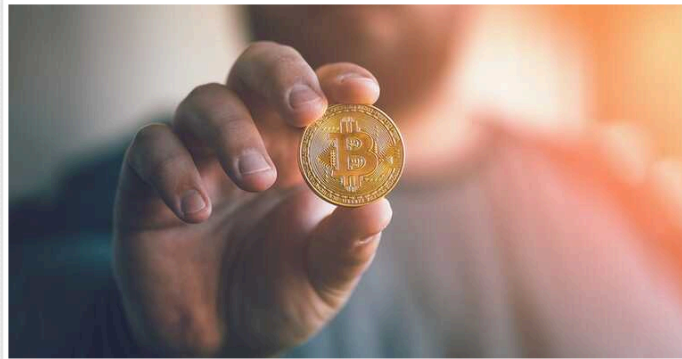
Айтїшника пограбували під час онлайн-співбесіди: скільки криптовалюти втратив

Невідомі зловмисники обікрали фрілансера просто під час співбесіди. Жертвою став турецький блокчейн-розробник Мурат Челіктепе, якому запропонували опрацювати код для онлайн-проєкту.