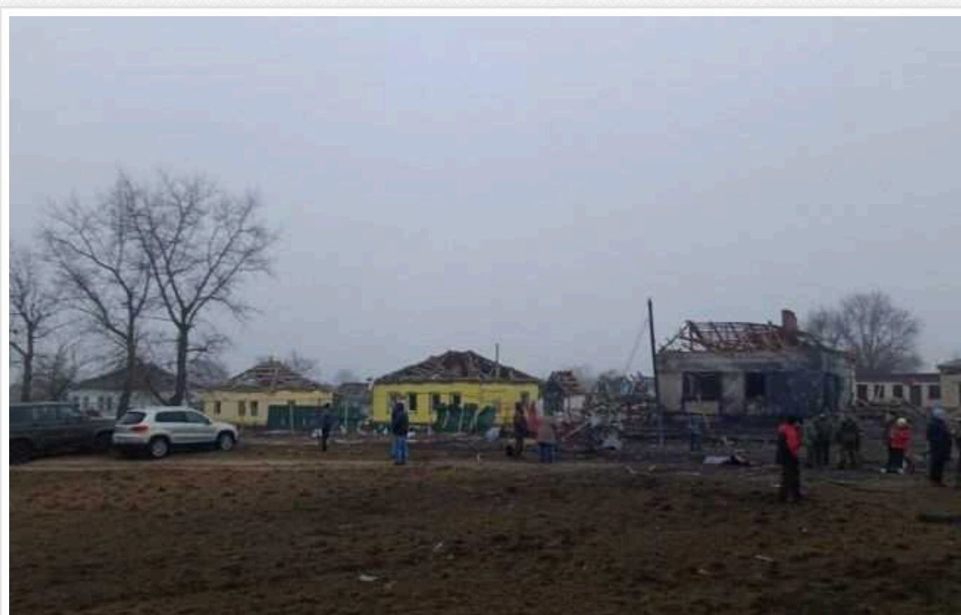
У Росії підтвердили, що ракета, яка летіла в Україну, впала у Воронежській області

Міноборони РФ назвали це "аварійним сходженням" російського боеприпасу, а місцевий губернатор каже, що обійшлося без постраждалих.