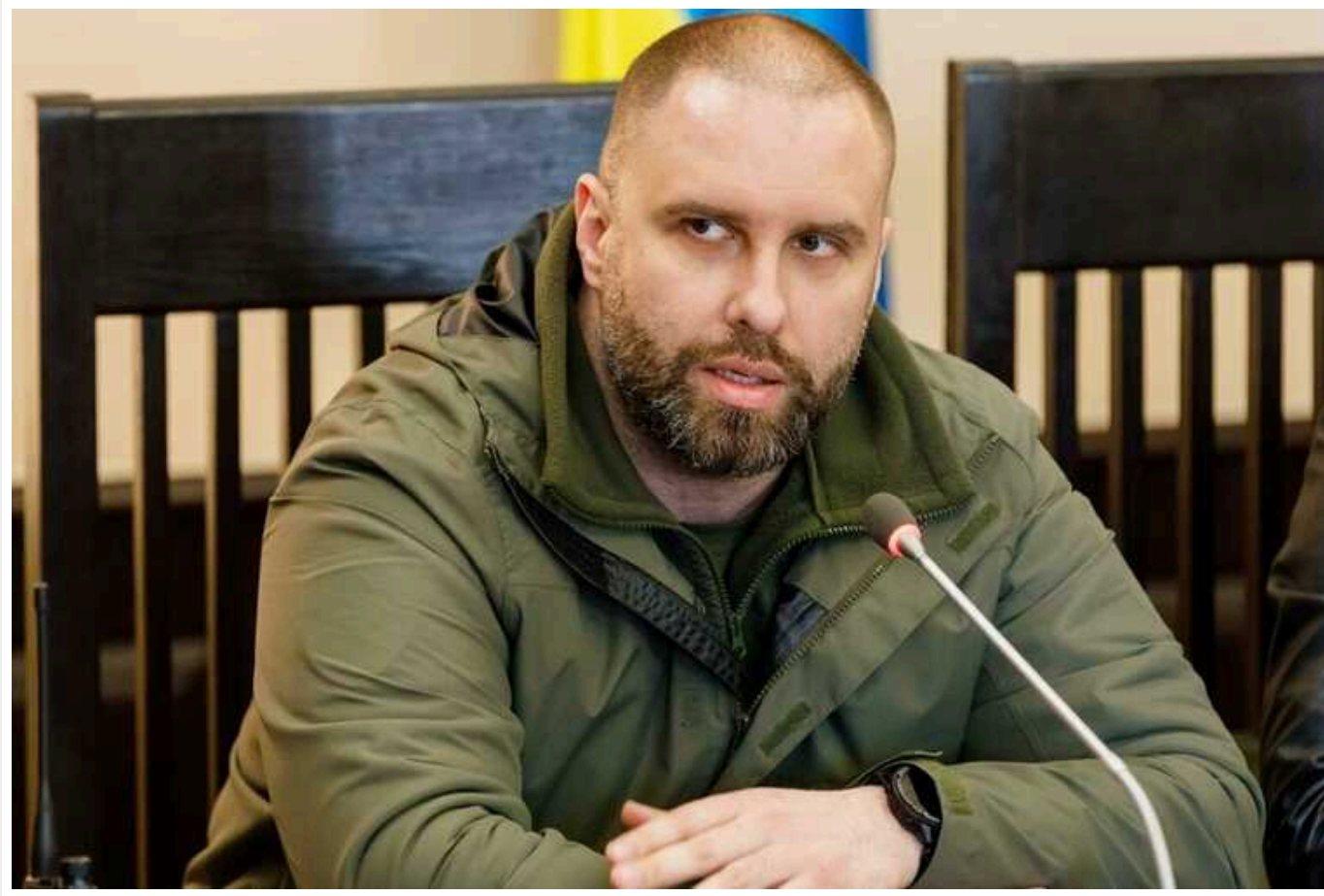
Окупанти завдали щонайменше 6 ракетних ударів по Шевченківському району Харкова