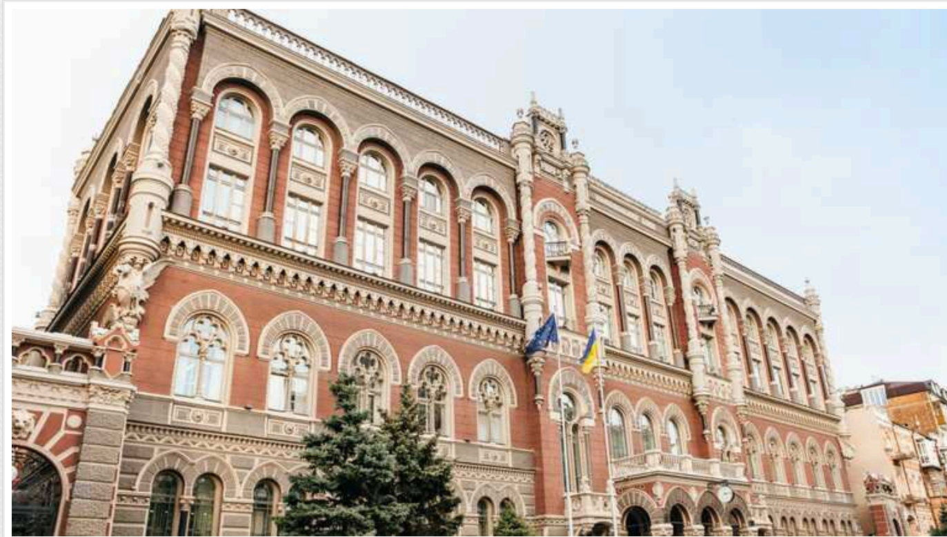
НБУ оновив офіційний курс гривні

Національний банк України оновив офіційний курс гривні до долара, який демонструє ослаблення національної валюти. Тепер 1 долар США коштує 38,0144 гривні.