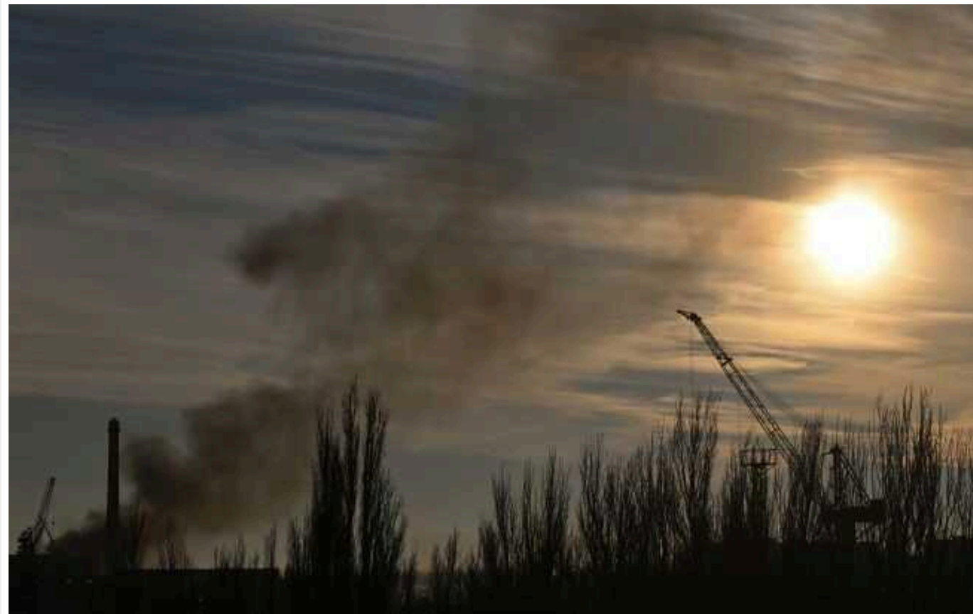
Окупанти завдали ударів по Харкову