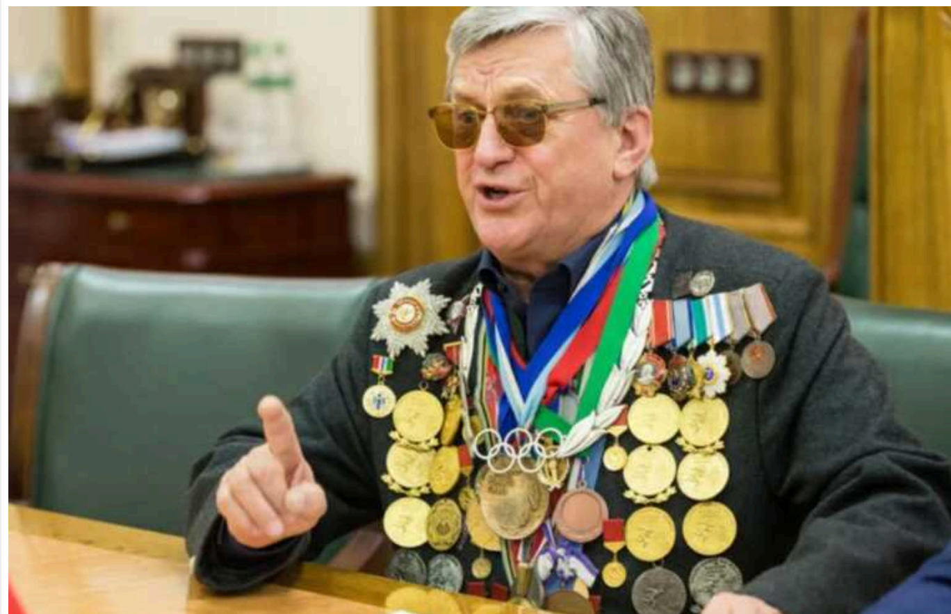
Російський чемпіон ОІ з біатлону проговорився про "досягнення" Путіна

Чотириразовий Олімпійський чемпіон Олександр Тихонов прогнущася перед кремльським диктатором Володимиром Путіним, на якого закликів рівнятися всіх росіян. При цьому колишній біатлоніст висловив сподівання, що в РФ відбудеться "відновлення економіки".