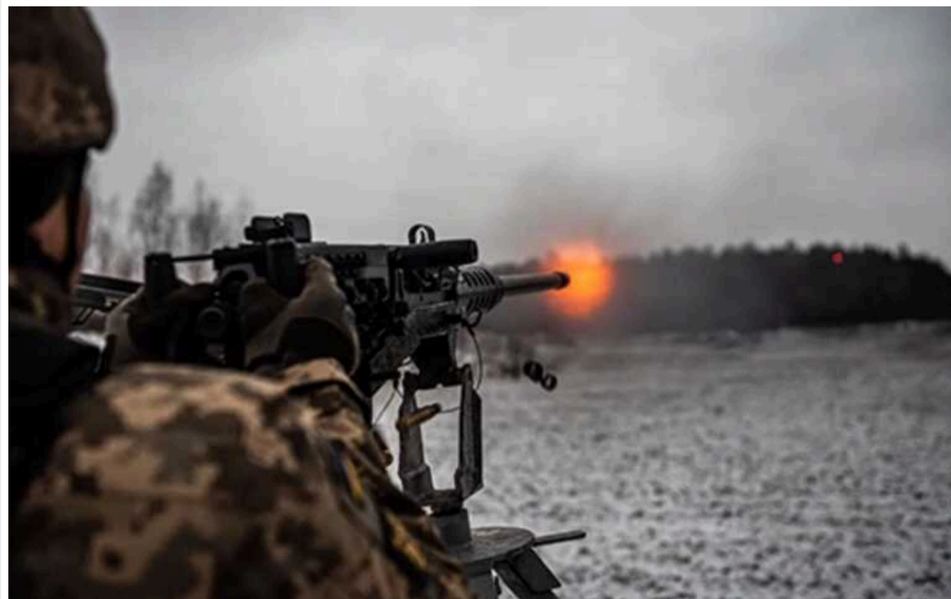
Загарбники спробували закріпитися біля стратегічного селища під Авдіївкою

Військові кажуть, що без дронів відбивати навалу орди було б значно важче.