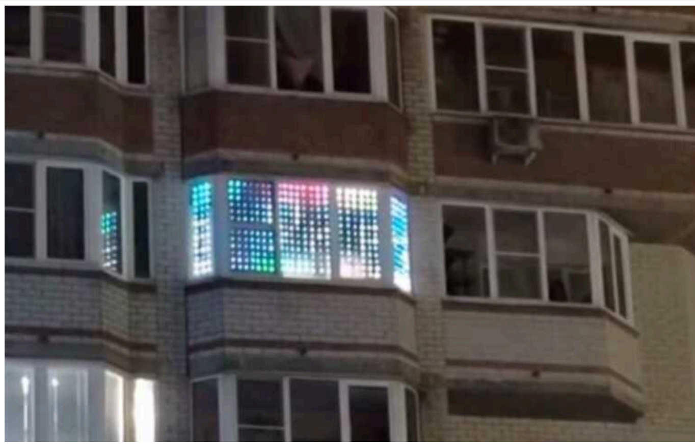
На мешканця російського Новгорода, який запустив на своєму балконі рухомий рядок із написом "Слава Україні", чекає судовий розгляд

У місті Великий Новгород у Росії мешканець розмістив на своєму балконі відео з рухомим рядком "Слава Україні" українською мовою.