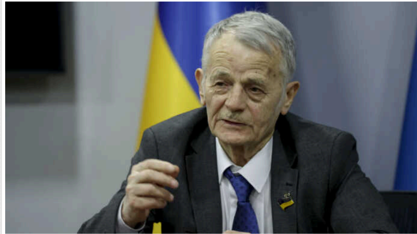
Джемелєв закликав росіян, які незаконно переселилися до Криму, залишити півострів

Лідер кримськотатарського народу Мустафа Джемелєв закликав громадян РФ, які переселилися до Криму, покинути півострів, поки функціонує Керченський міст.