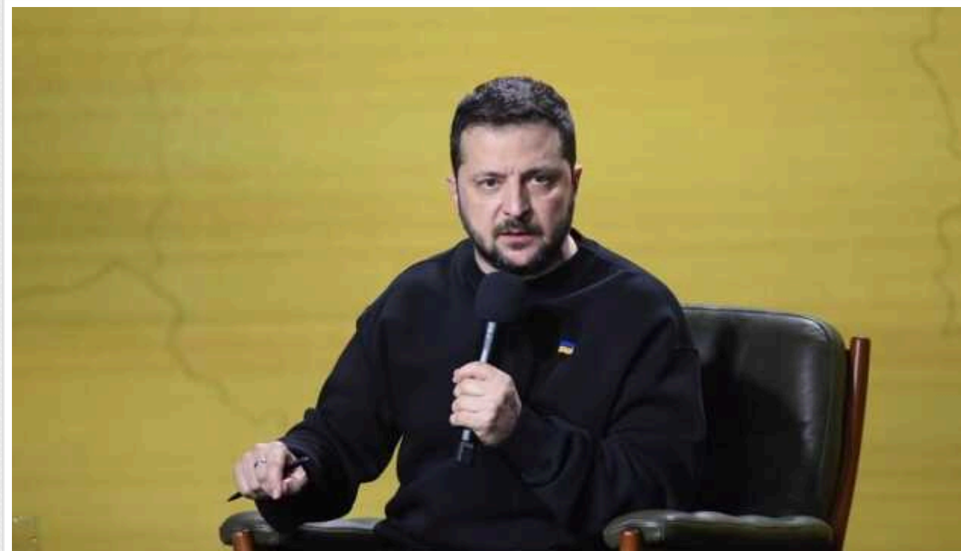
Надаючи Україні зброю та гроші, Європа рятує своїх дітей, - Зеленський

Путінська армія не спромоглася захопити у 2023 році жодного великого міста, тоді як Україна змогла прорвати російську блокаду Чорного моря, що дає змогу перевозити мільйони тонн зерна.