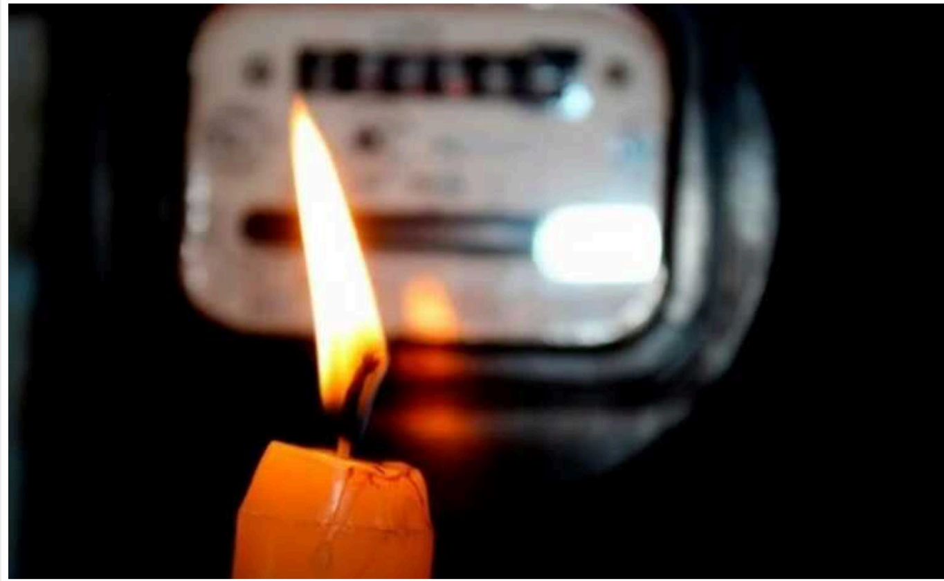
У низці населених пунктів Луганської області майже три тижні немає світла, - ОВА

У низці окупованих населених пунктів Луганської області електрика відсутня вже майже три тижні.