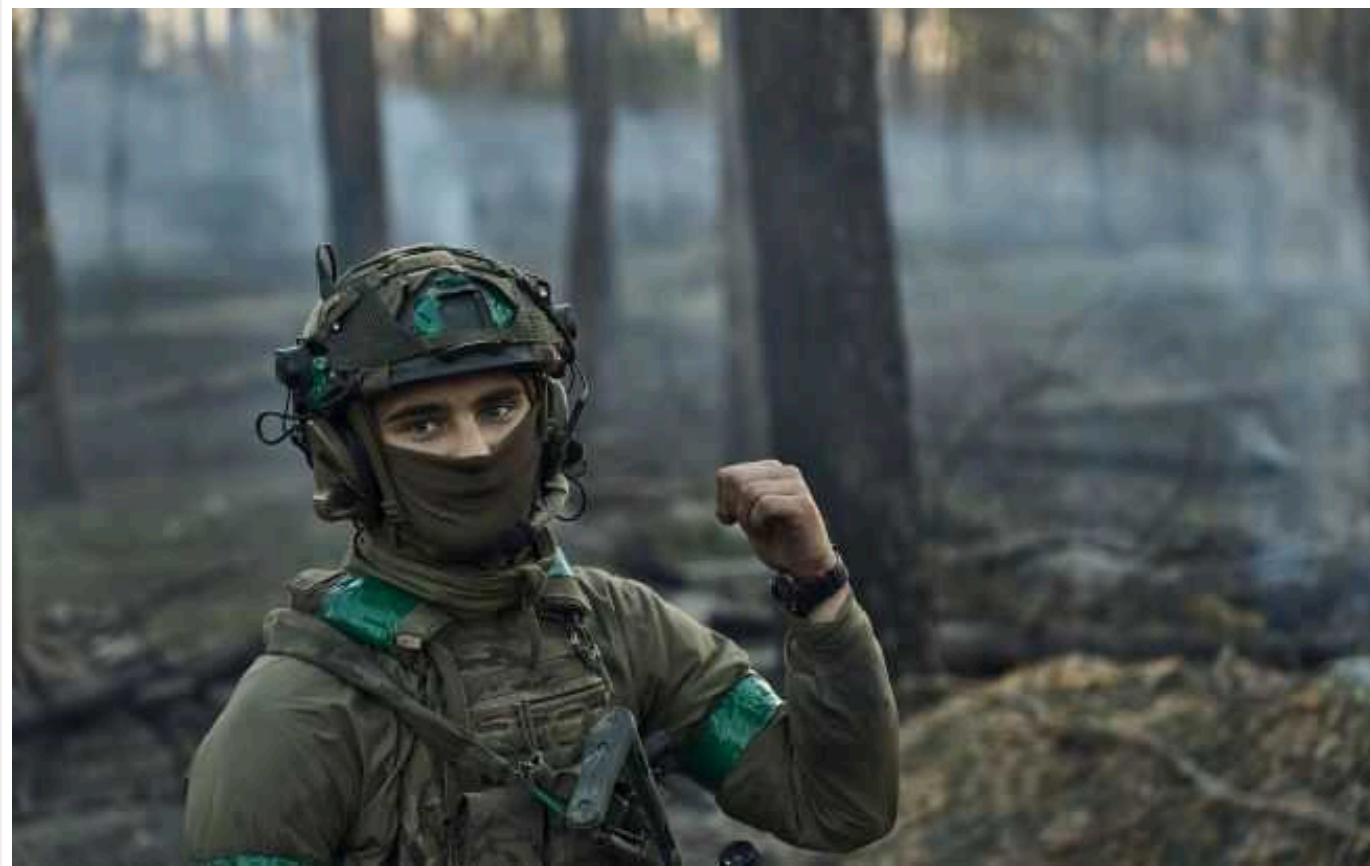
Прикордонники під Куп'янськом знищили ворожу позицію разом із окупантами

Сили оборони України на Куп'янському напрямку виявили позицію росіян і вдарили по ній. Процес знищення окупантів вдалося зафіксувати на відео.