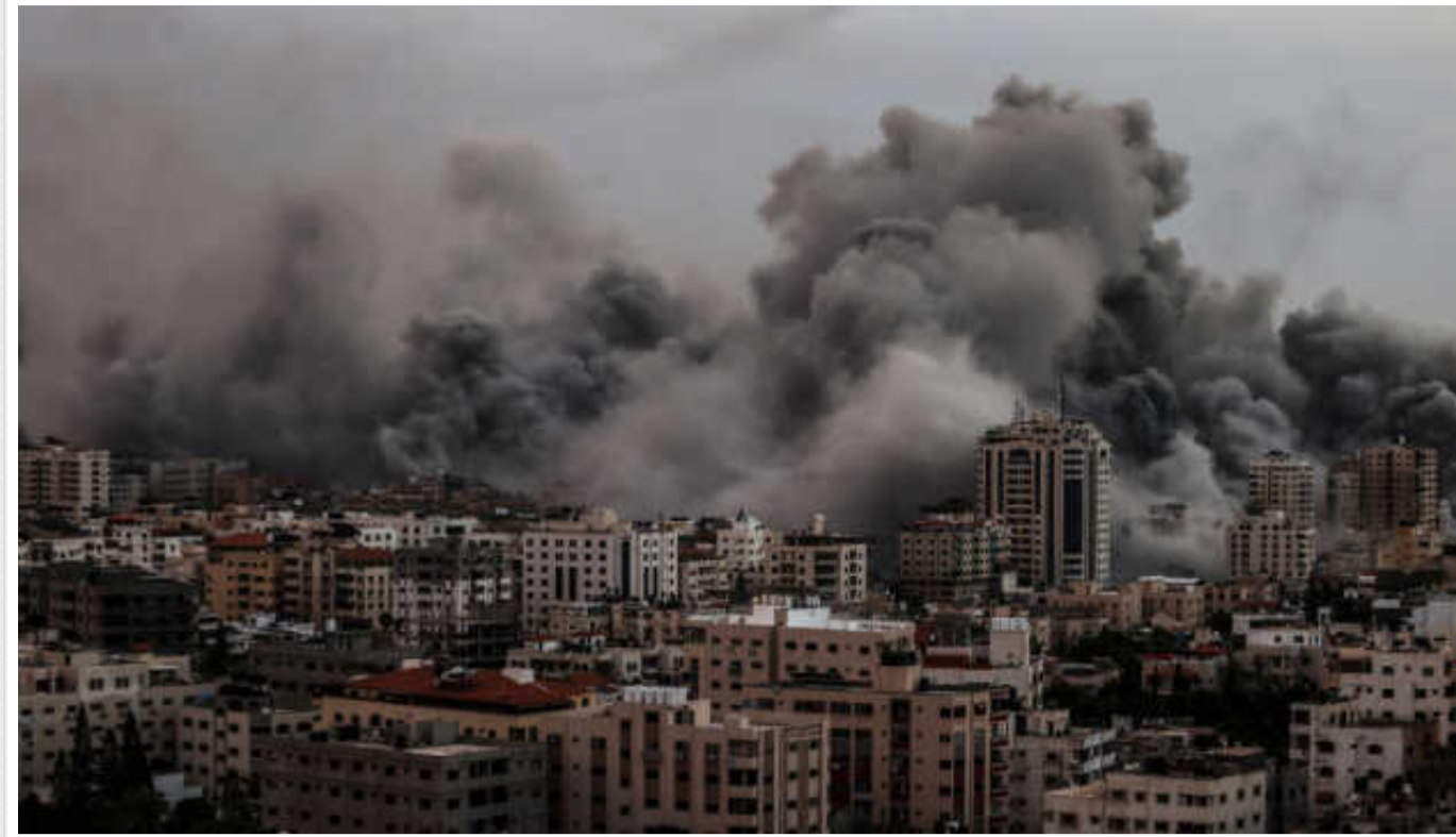
Бойові дії в Секторі Гази переходять у менш інтенсивну фазу - адміністрація США

Оголошення Ізраїлем про скорочення своєї військової присутності в Секторі Гази вказує на ознаки поступового переходу бойових дій до фази меншої інтенсивності.