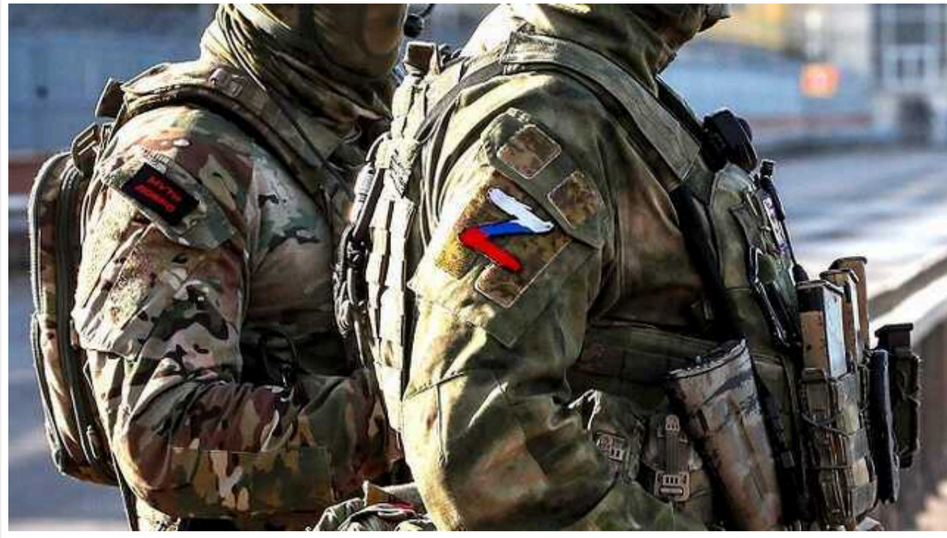
Окупанти на узбережжі Азовського моря продовжують облаштовувати тренувальні бази, - Федоров

Російські військові продовжують облаштовувати свої бази на тимчасово окупованих територіях Запорізької області. При цьому ворог знищує екологію регіону.