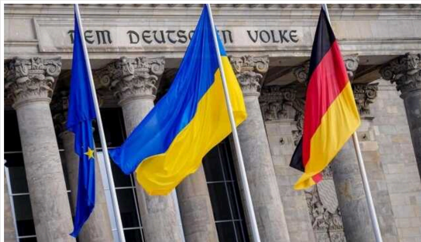
Німці не вірять, що війна в Україні закінчиться у 2024 році

Згідно з опитуванням, проведеним соціологічним інститутом YouGov на замовлення DPA, лише 15 відсотків опитаних мешканців Німеччини вважають можливим завершення війни в Україні протягом найближчих 12 місяців.