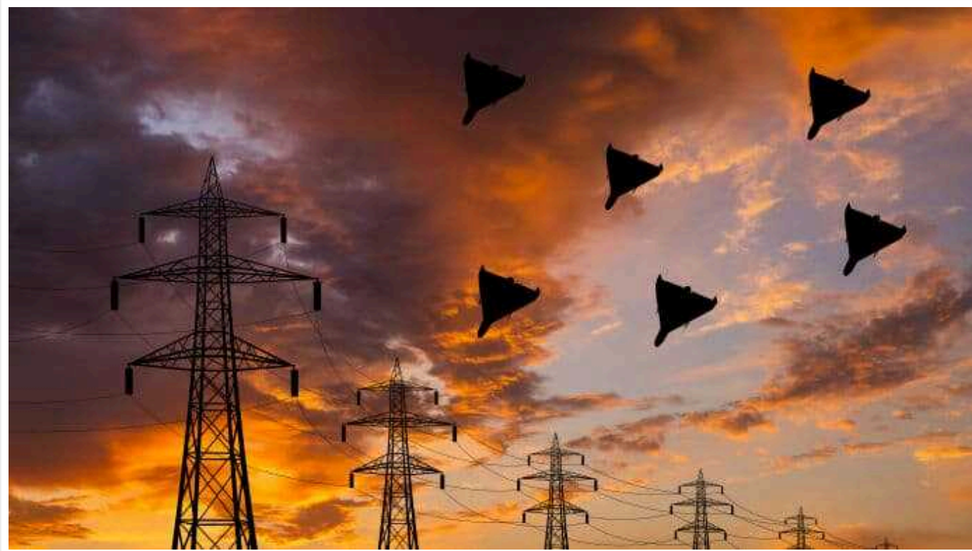
Окупанти знову запустили ударні безпілотники

Російські війська у понеділок увечері знову запустили ударні безпілотники по території України.