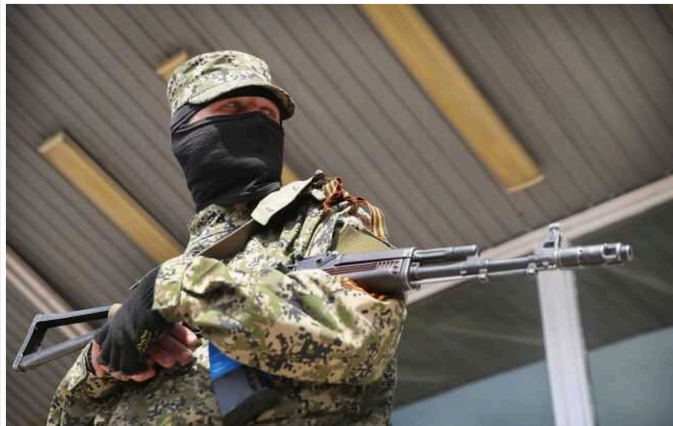
У Житомирі оголосили вирок бойовику "ДНР": взяв кредит і пішов воювати за окупантів

Жителя Слов'янська (Донецька область), який вступив до лав "ДНР" і воює за окупантів, засудили до 12 років в'язниці.