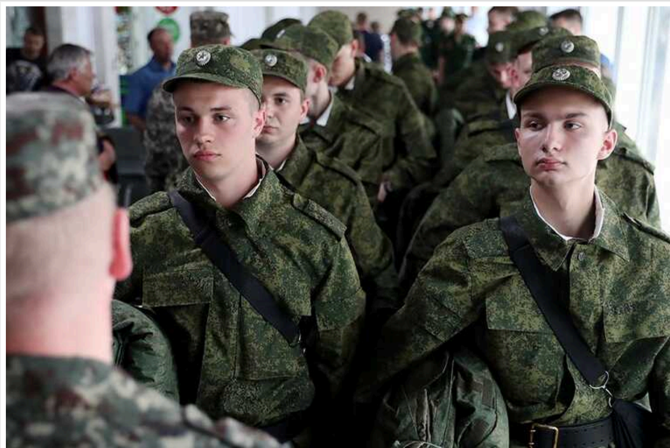
У Росії збільшили призовний вік: в армію зможуть набирати строковиків у 30 років

У Росії набув чинності закон, який збільшив призовний вік. Тепер в армію зможуть набирати людей у 30 років.