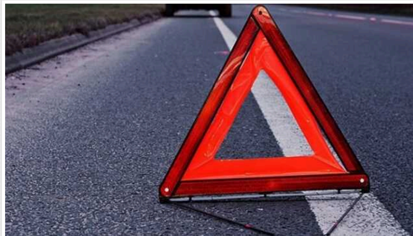
ДТП на Полтавщині: легковик з'їхав у кювет і врізався в дерево, є загиблі

Сьогодні, 1 січня, в селищі Нехвороща на Полтавщині легковик з'їхав у кювет та врізався в дерево, внаслідок чого загинув його водій та пасажир.