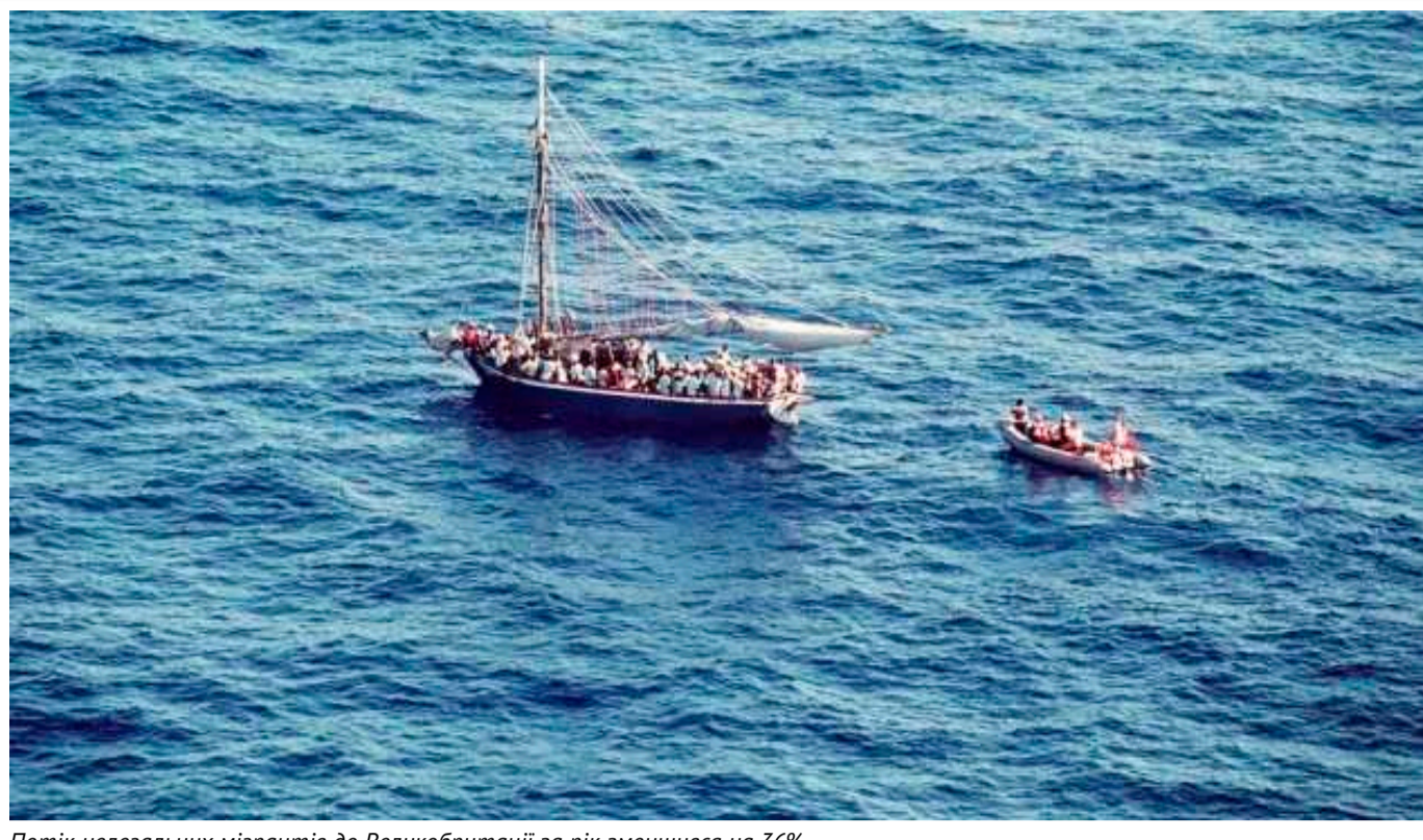
Потік нелегальних мігрантів до Великобританії за рік зменшився на 36%

У 2023 році до Великої Британії на невеликих човнах нелегально прибули 29 437 мігрантів, що на 36% менше, ніж роком раніше.