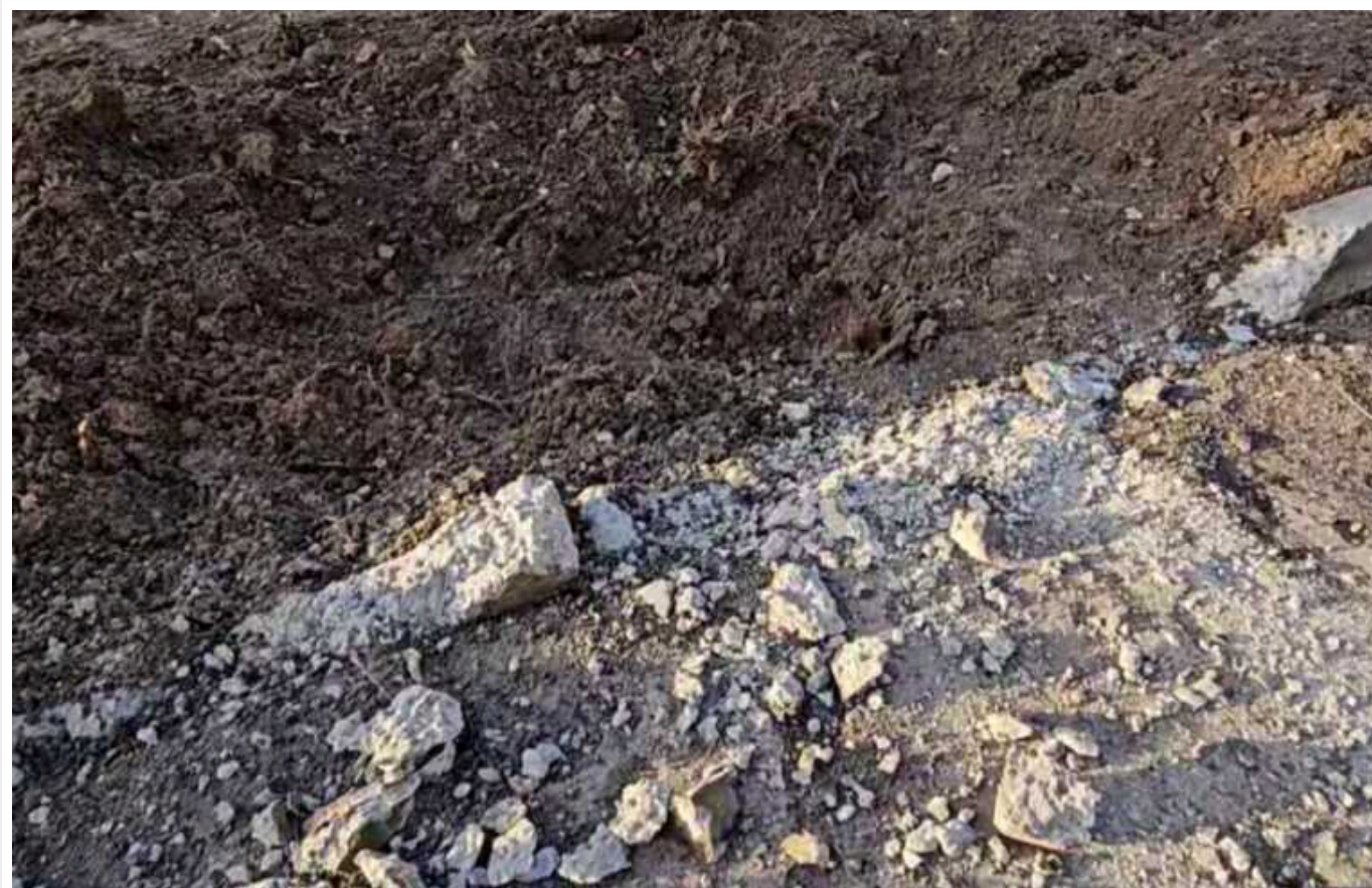
Окупанти обстріляли Херсон: постраждала жінка

Сьогодні, 1 січня, ворожі війська продовжували обстрілювати територію Херсону.