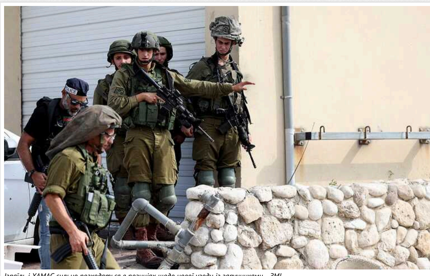
Ізраїль і ХАМАС сильно розходяться в позиціях щодо нової угоди із заручниками, - ЗМІ

Погляди ХАМАСу та Ізраїлю сильно розходяться в позиціях щодо нової угоди зі звільнення заручників.