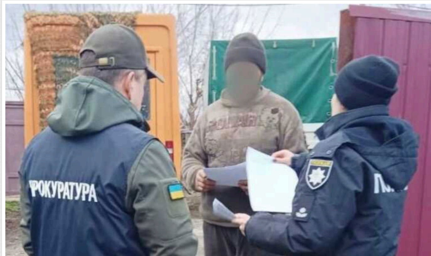
На Харківщині викрито чотирьох чорних лісорубів: нарубили лісу зі збитками майже на 650 тисяч гривень

За процесуального керівництва Куп'янської окружної прокуратури Харківської області повідомлено про підозру чотирьом чоловікам за фактом незаконної порубки дерев, що спричинила тяжкі наслідки (ч. 4 ст. 246 КК України).