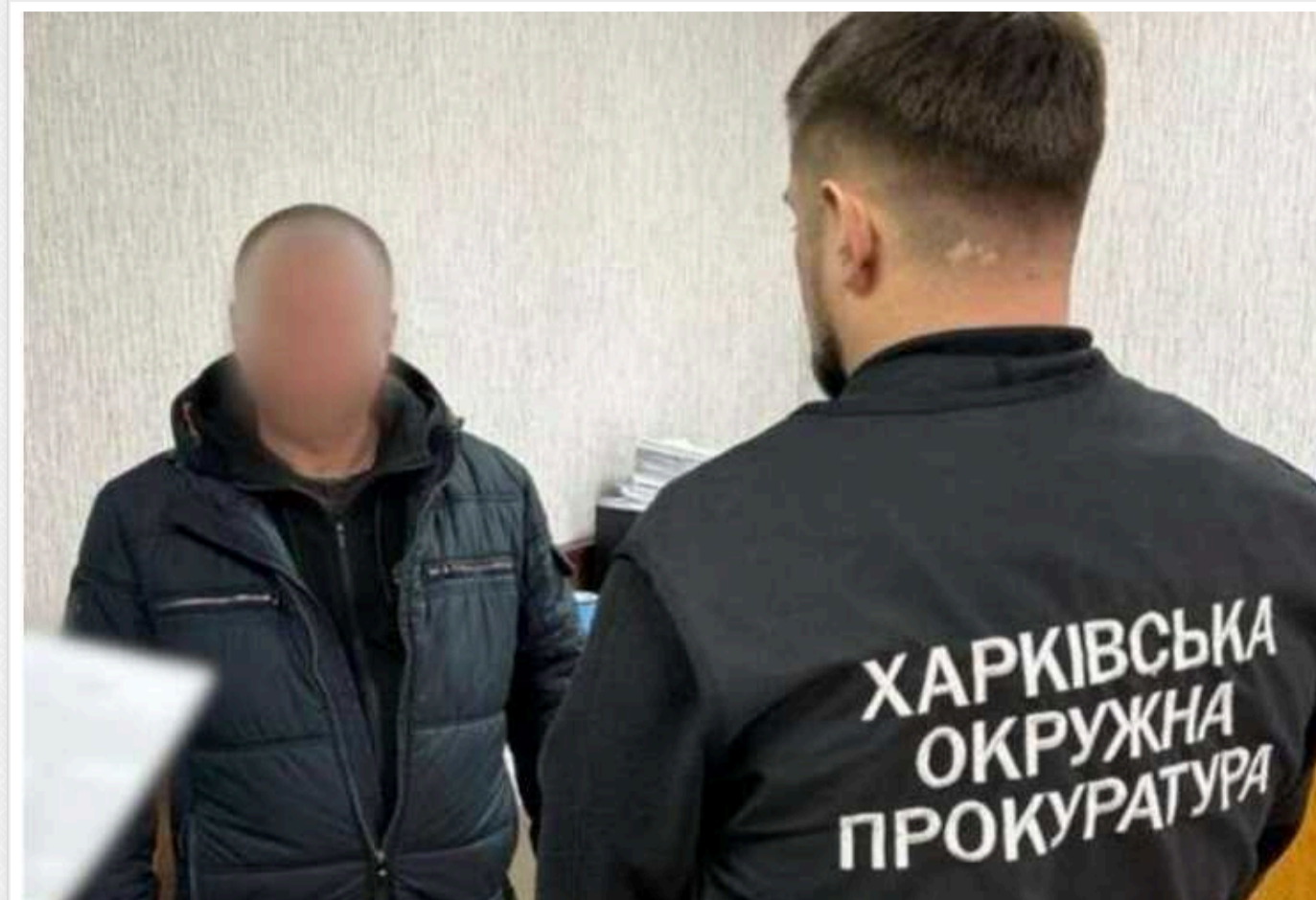
На Харківщині судитимуть колаборанта, який збирався «чудово жити під владою РФ»

Харківською окружною прокуратурою Харківської області затверджено та направлено до суду обвинувальний акт стосовно 46-річного чоловіка за фактом колабораційної діяльності (ч. 1 ст. 111-1 КК України).