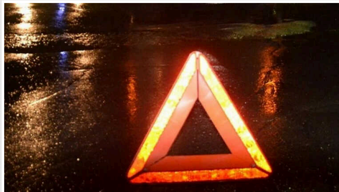
ДТП у Києві: на бульварі Дружби народів спортивне авто вилетіло на тротуар

01 січня у Києві. Спортивний Porsche на бульварі Дружби народів вилетів на тротуар, та, ймовірно, серйозно пошкодив ходову об бордюр.