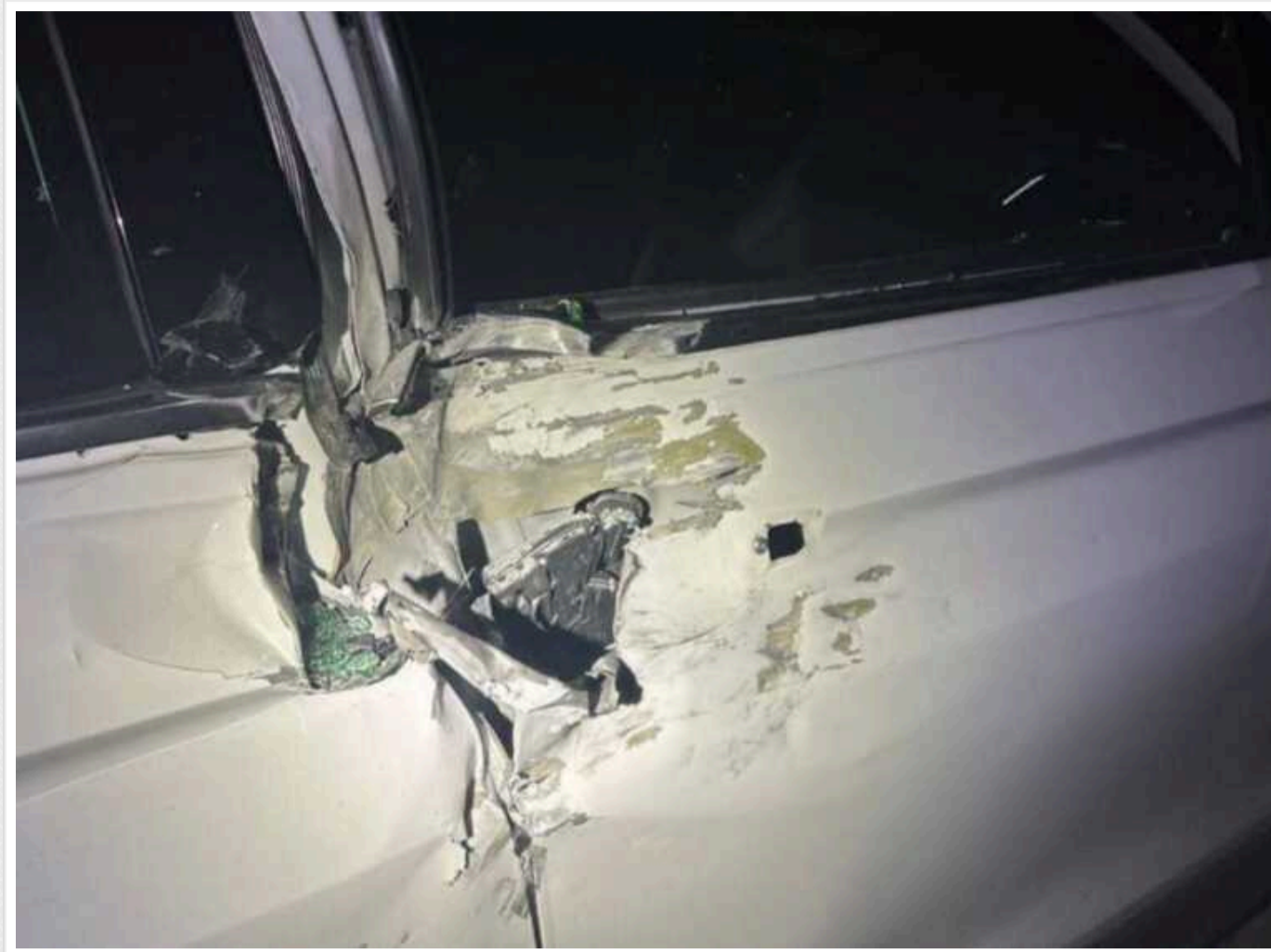
Уламки збитих цілей упали в декількох населених пунктах Київщини, — ОВА

Завдяки ефективній роботі захисників, потраплянь в об'єкти критичної інфраструктури немає, повідомили у відомстві.