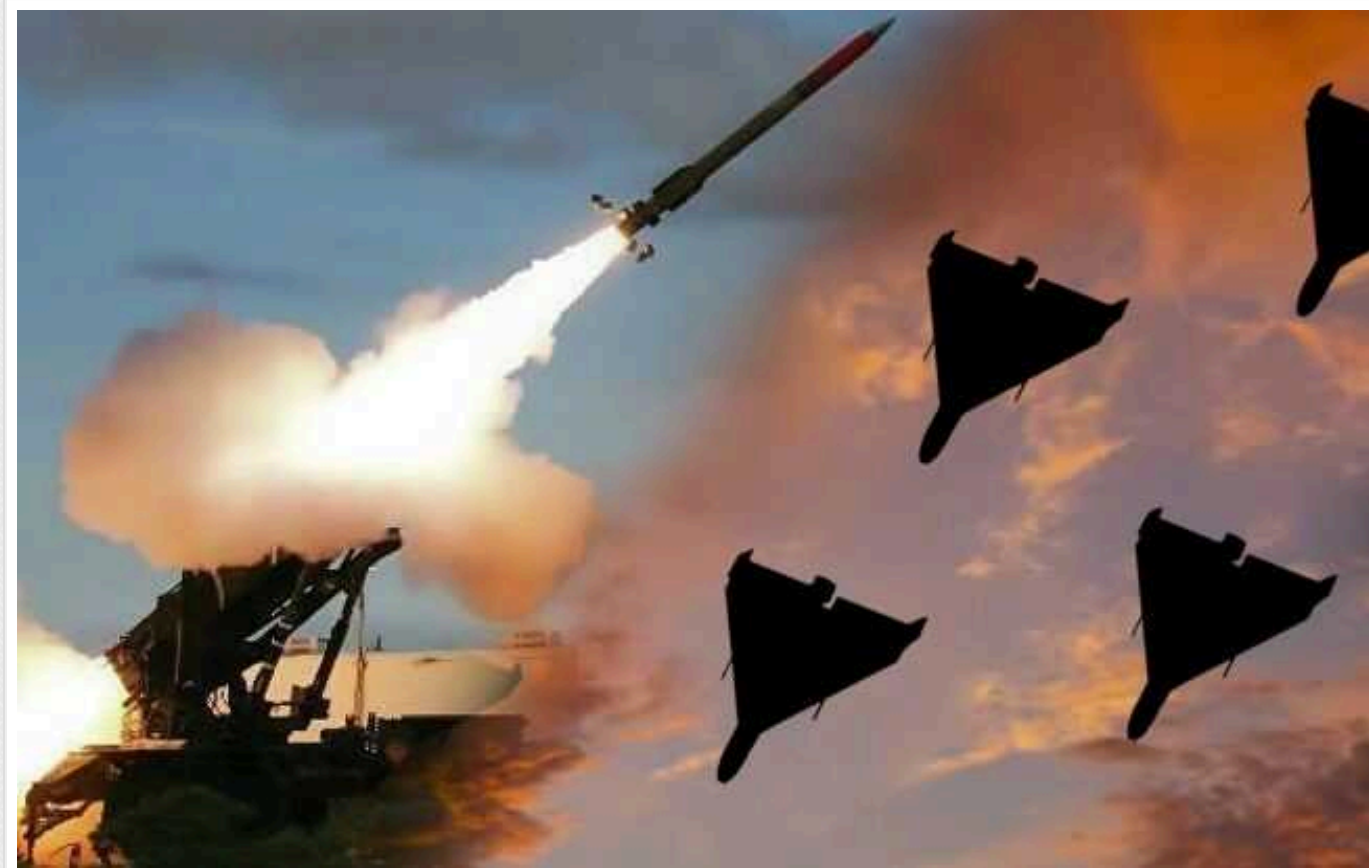
Українські військові знищили дев'ять "Шахедів"

Українським військовим сьогодні, 1 січня, вдалося збити дев'ять російських дронів-камікадзе. Це сталося під час денної атаки "Шахедів" із півночі.