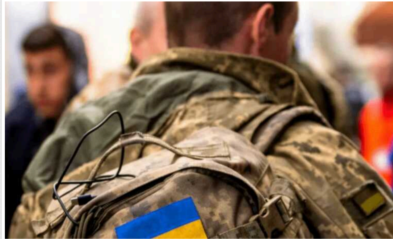
Як оформити відстрочку від мобілізації з догляду за хворим, - пояснення юристів

За інформацією юристів, закон дозволяє офіційно оформити постійний догляд за хворою людиною. Такі послуги можуть надаватися на професійній чи непрофесійній основі.