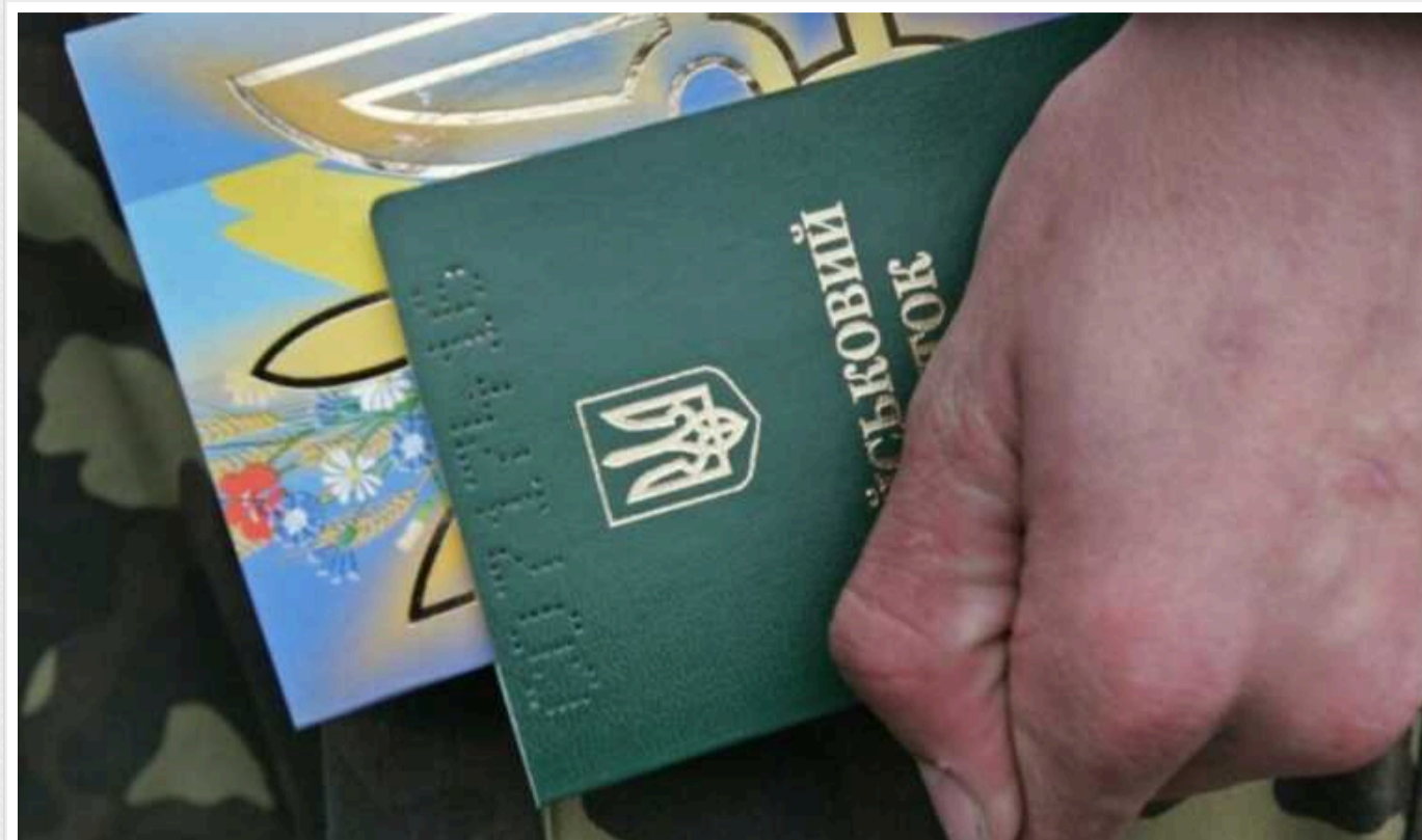
ЗМІ пишуть про посилення мобілізаційних заходів у Чернівецькій області: в ОВА все спростовують

Відповідно до документа, який розповсюджено в соцмережах, в області нібито хочуть розгорнути пункти оповіщення, запровадити перевірку документів та огляд речей, автомобілів, багажу.