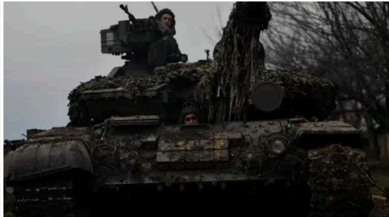
Ситуація на фронті: відбулось 56 бойових зіткнень, на кількох напрямках були штурми

З початку нового 2024 року на фронті вже відбулось 56 бойових зіткнень із російськими окупантами.