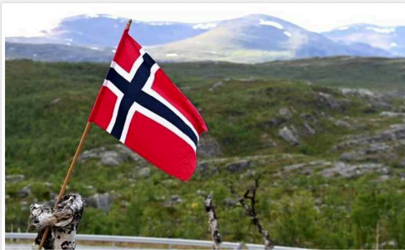
У Норвегії дозволили прямий продаж Україні зброї та продукції оборонки

Уряд Норвегії вирішив дозволити прямий продаж зброї та продукції оборонного призначення від своєї оборонної промисловості Україні.