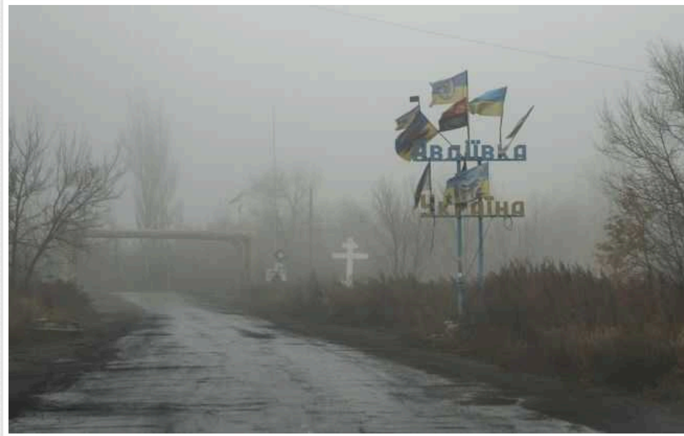
Загарбники з артилерії вдарили по Авдіївці: є загибла

Російські війська сьогодні, 1 січня, вдарили по Авдіївці в Донецькій області з артилерії. Унаслідок ворожої атаки загинула жінка.